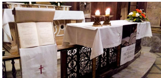
La Paraula entronitzada a la capella del Santíssim, de la Basílica de Vilafranca

llibre del Gènesi. Unes 40 persones van fer-se presents a la capella del Santíssim, ambientada per a l'ocasió. La pregària va ser una lectio divina del text Gènesi 37,17-27 , i va comptar amb moments de comentari, pregàries en veu alta, silenci, i també la pregària de diversos salms. Aprofitant aquest acte, es va inaugurar a la capella del Santíssim de la basílica un lloc de la Paraula, on restarà exposat el leccionari de cara al poble sempre que no hi hagi la celebració de l'Eucaristia.