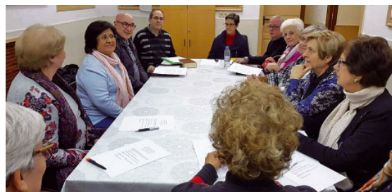
Celebració ecumènica de la Paraula, a Gavà

Dimarts 27 de novembre es va fer a la basílica de Santa Maria una pregària-celebració a partir de la Paraula de Déu. L'acte va ser organitzat pel grup bíblic que es reuneix quinzenalment a la paròquia, i que durant aquest curs està estudiant el